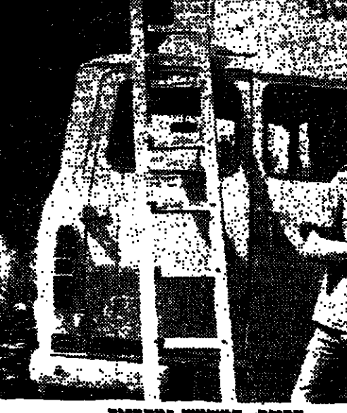
המחבלים עוברים אימון אישי בעזרת מדריכים

מחבלים עוברים אימון אישי בעזרת מדריכים. הם לומדים טכניקות חדשות, הם לומדים לנהל את עצמם, הם לומדים להיות חזקים. זהו הדבר הראשון שחשבו אנשים בשטחים, כשדברו על הסכם ההפרדה.